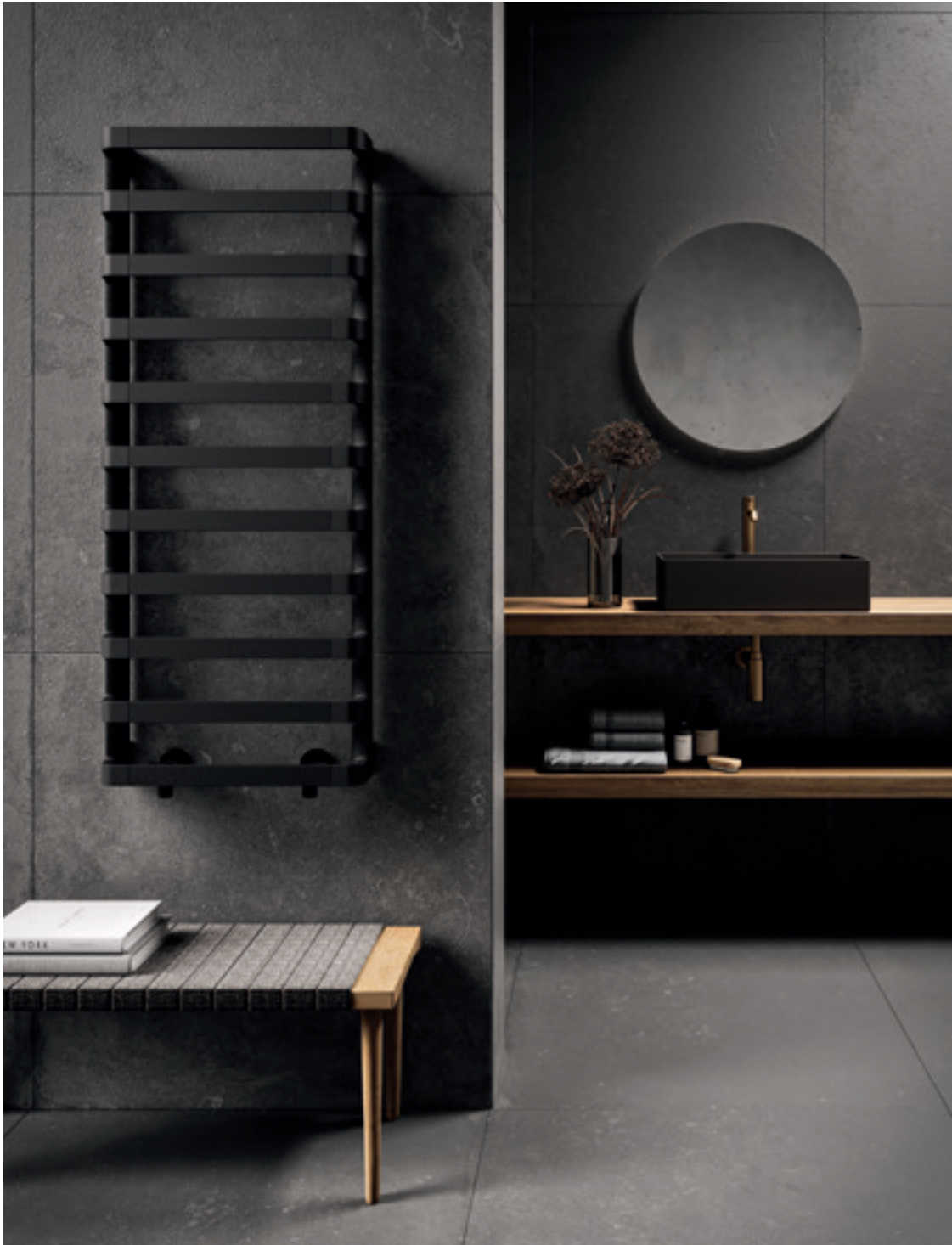
STEP_B Înălțimea 1240 mm, lățimea 600 mm. Finisaj Negru Satinat (cod. 30) Designed by Antonio Citterio cu Sergio Brioschi